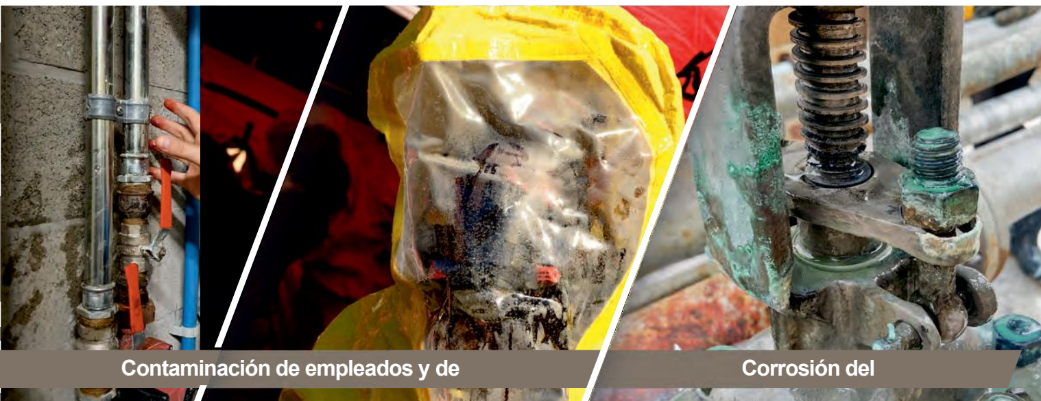
Contaminación de empleados y de