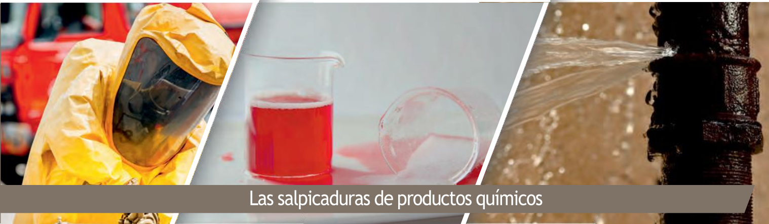
Las salpicaduras de productos químicos